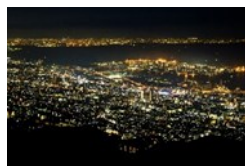
六甲山からの夜景