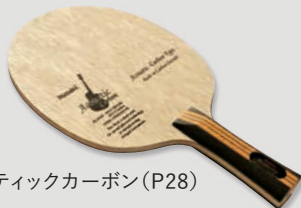
アコースティックカーボン (P28)