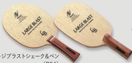
ラージプラスシェーク&ペン (P54)