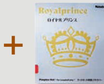
ロイヤルプリンス (P52)