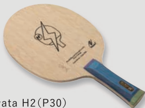
Hina Hayata H2 (P30)