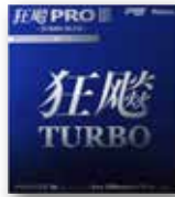
キョウヒョウプロ3 ターボブルー