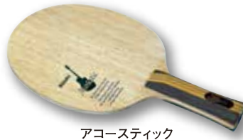
アコースティック