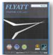
フライアットソフト