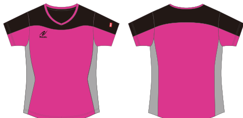
NW-2317 ゲームシャツⅢ女子用・LA