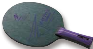
ファクティブカーボン