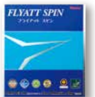
フライアットスピン