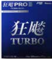
キョウヒョウプロ3 ターボブルー