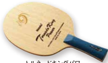
トルネードキングパワー