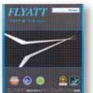
フライアットソフト