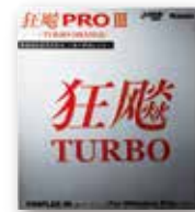
キョウヒョウプロ3 ターボオレンジ