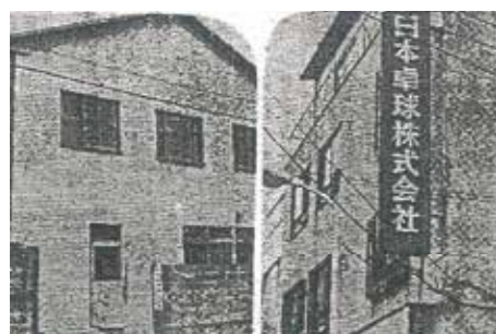
1947 卓球専門メーカーとして事業開始