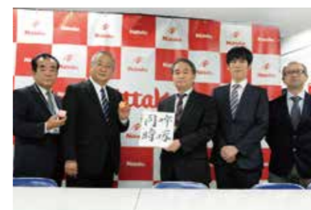
2013 世界初プラスチックボール発表会