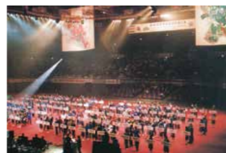
2001 40ミリ初の世界卓球、使用球