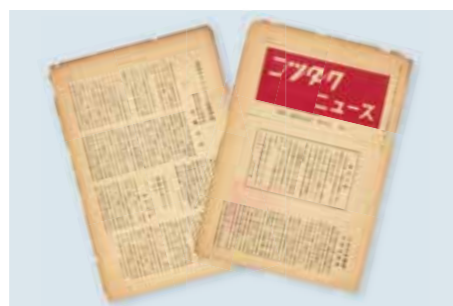
1947 ニッタクニュース創刊