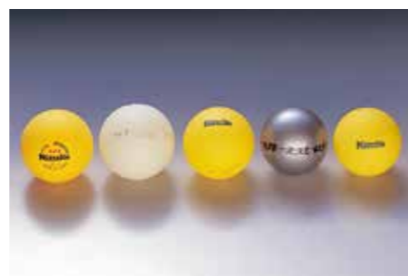
1988 ラージボールの研究開発に尽力