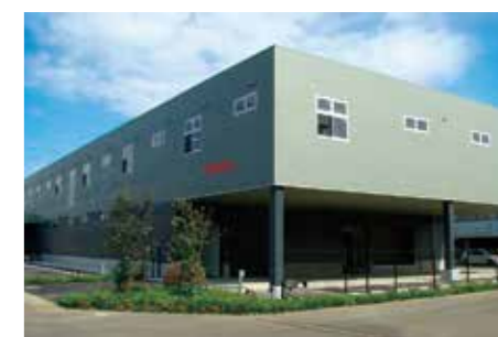
2017 最新鋭ボール工場「NECO'S」設立